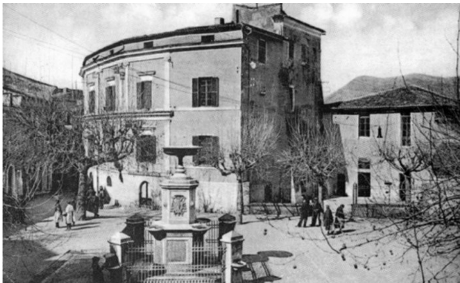
Sezze, Fontana in P.za De Magistris, detta di Pio IX, costruita nel 1866

«Cedendo alla Forza consegno questo libro parrocchiale protestando contro l'oppressione. Suso 17 febbrajo 1871 Luigi Curato Belitrando» 192