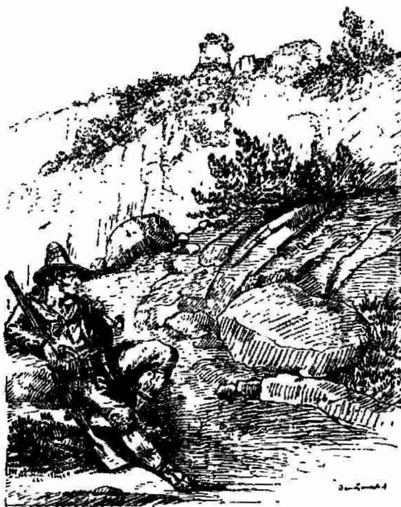
Un repaire de brigands, près de Sezze, fouillé par les zouaves pontificaux.

Un covo dei briganti, presso Sezze, ispezionato dagli Zuavi pontifici (da F. LE CHAUFF DE KERGUENEC, Souvenirs des Zouaves Pontificaux : 1864, 1865 et 1866, Paris 1891, p. 283)